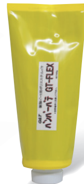
製品コード 内容量 I3002 80g

仕上げ用中間パテです。柔らかくへら延びを重視した設計ですが、高性能低収縮樹脂を採用しており、塗り重ねても歪みにくいのが特徴です。マイクロビーズを配合し、優れた研磨性ときめ細かさを両立しました。(専用硬化剤…シクロヘキサノン、イエロー)