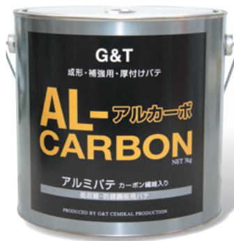
製品コード 内容量 I0103 3kg

3種類の個性的なパテで、厚付け、成形補修から仕上げまで、さらに樹脂部品まで対応できる、コンパクトなラインナップが特徴です。