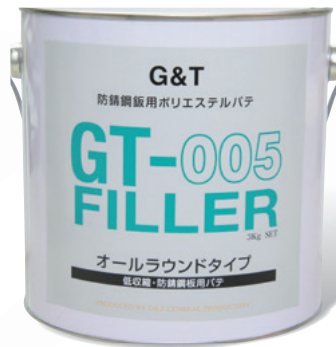
製品コード 内容量 I0104 3kg

成型から仕上げまで幅広く使用できる万能ポリエステルパテです。アルミフレークと炭素繊維を配合し、厚付け時の強度や低収縮性を強化しました。また中空ビーズを含まず、耐久性・耐水性にも配慮しています。(専用硬化剤…ベンジルパーオキシサイド、ブルー)